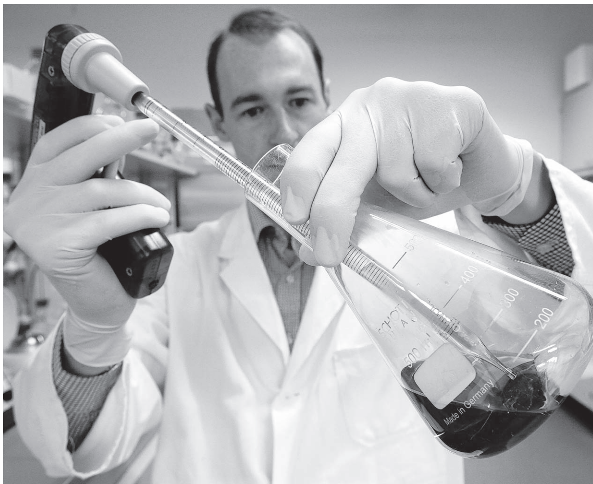
Wieder mit expansiven Investitionsplänen: Die Chemische Industrie will 2010 in Deutschland wieder kräftig investieren und damit ihre Produktion steigern.

nicht höher ist, führt der DIHK auf die Stabilisierung auf den Finanzmärkten, unkonventionelle Maßnahmen der Notenbanken und staatliche Bankenrettungsschirme zurück.